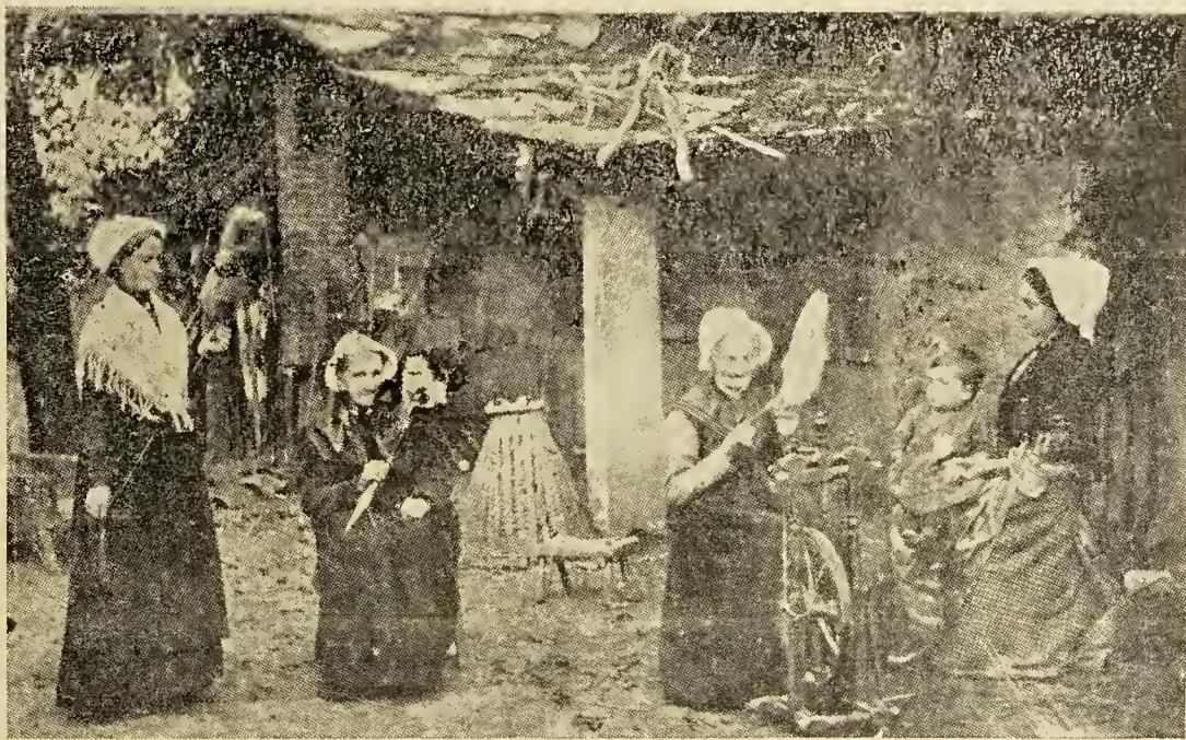
Torre Pellic — Vestidos típicos valdenses

La Iglesia Valdense ve en todos esos movimientos de carácter ecuménico, un esfuerzo